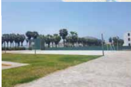
ÁREAS COMUNES DEL CONDOMINIO