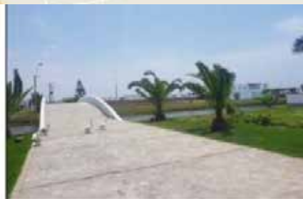
ÁREAS COMUNES DEL CONDOMINIO